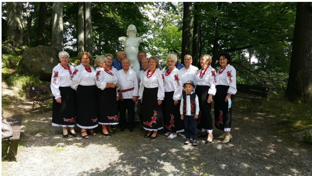
Zespół folklorystyczny z Lubania „Echo Bukowiny”

W ramach oprawy artystycznej otwarcie tej wystawy było poprzedzone występem zespołu folklorystycznego z Lubania „Echo Bukowiny”.